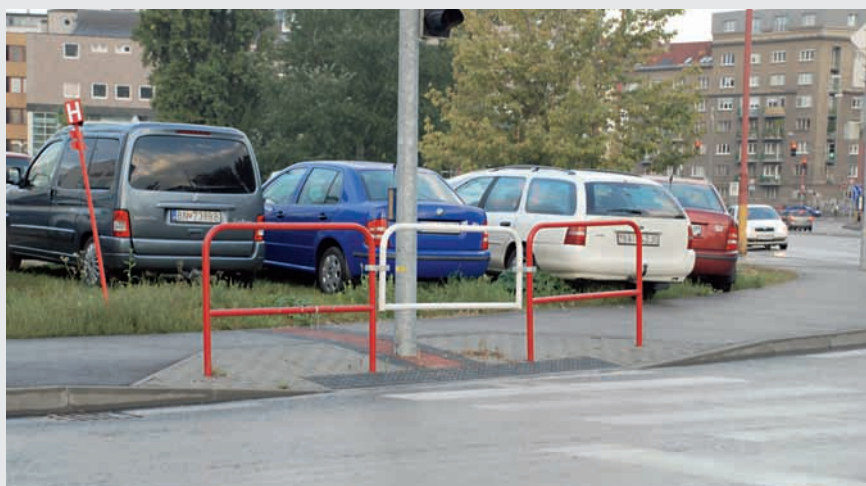
Obr. 8 Bez komentára, fotka hovorí sama za seba.

If I were to conduct a survey among people consisting of one question – what movement without limits means for them – I would get a range of answers. Without hesitation a student might answer that it would be travelling to faraway countries for adventure and experiences, even with only a few cents in his pocket. Perhaps a bus driver who is a big fan of racing would say that he dreams of driving at great speeds in a top-level Formula 1 car. Other answers would be given by a nun, a writer, parachutist, diver, musician, dentist... We all have our own dreams about stepping outside our barriers and limits, and whether these are physical or spiritual barriers it's up to the individual to make it come true. For us handicapped people however the dream ends at the first step – whether we want to overcome it or not.