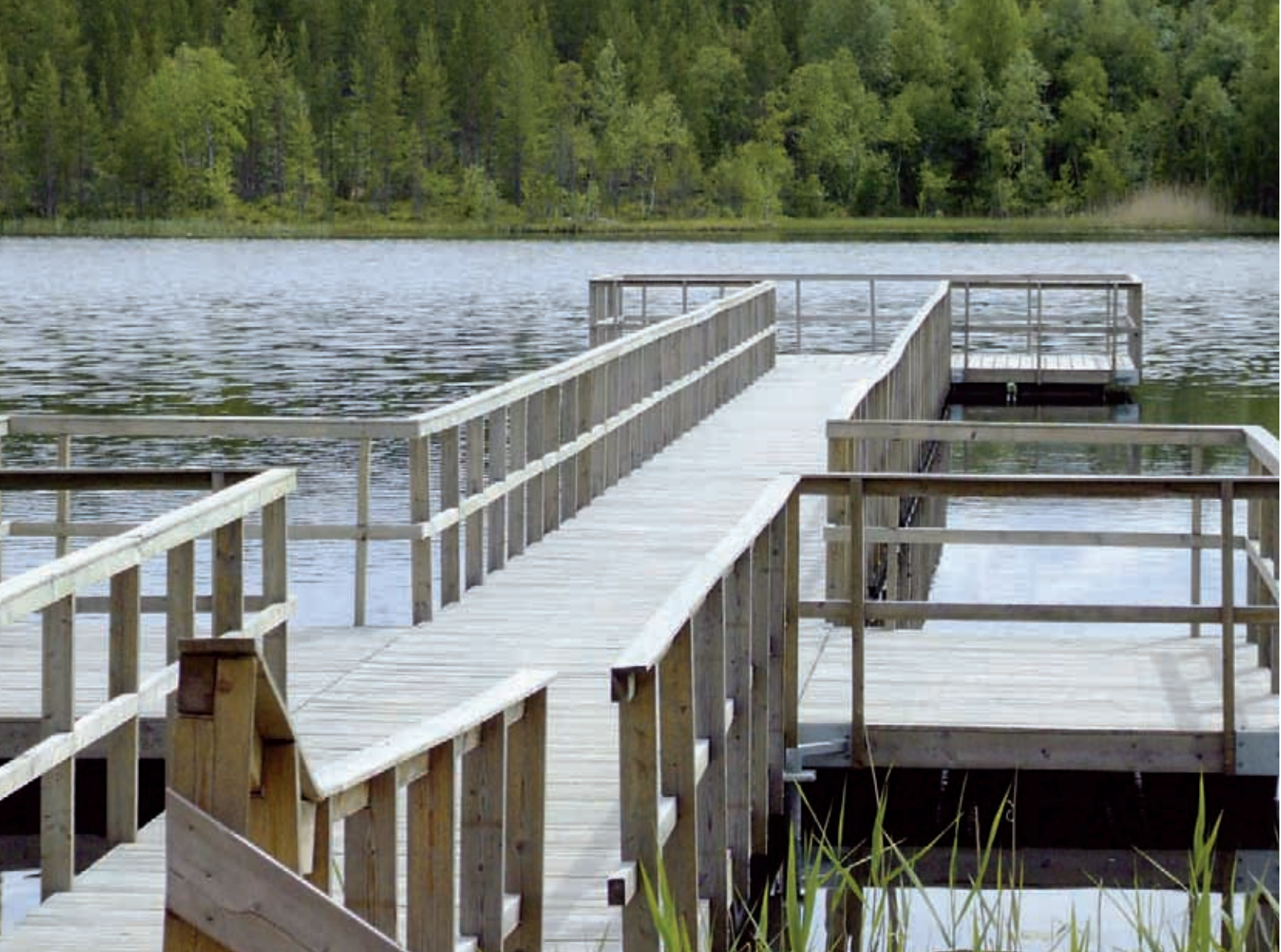
Obr. 1 Bezbariérový navrhnuté a zrealizované mólo na rybárčenie, Švédsko