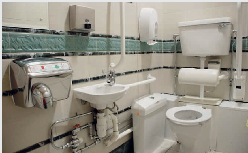
Obr. 7 Niektoré WC pre vozičkárov v zahraničí pripomínajú raketovú základňu.

Nie je v mojej povahe vzdávať sa, a preto som v spolupráci s Výskumným a školiacim centrom bezbariérového navrhovania, Fakultou architektúry STU v Bratislave a mojím kolegom ponúkajúcim bezbariérové riešenia začal pracovať na projekte, dovoľm si povedať, že jedinečnom – na Monitoringu bezbariérovosti. Objekty nehodnotíme, ale opisujeme ich aktuálny stav a vkladáme tieto informácie do živých databáz. Následnou filtráciou (v budú-