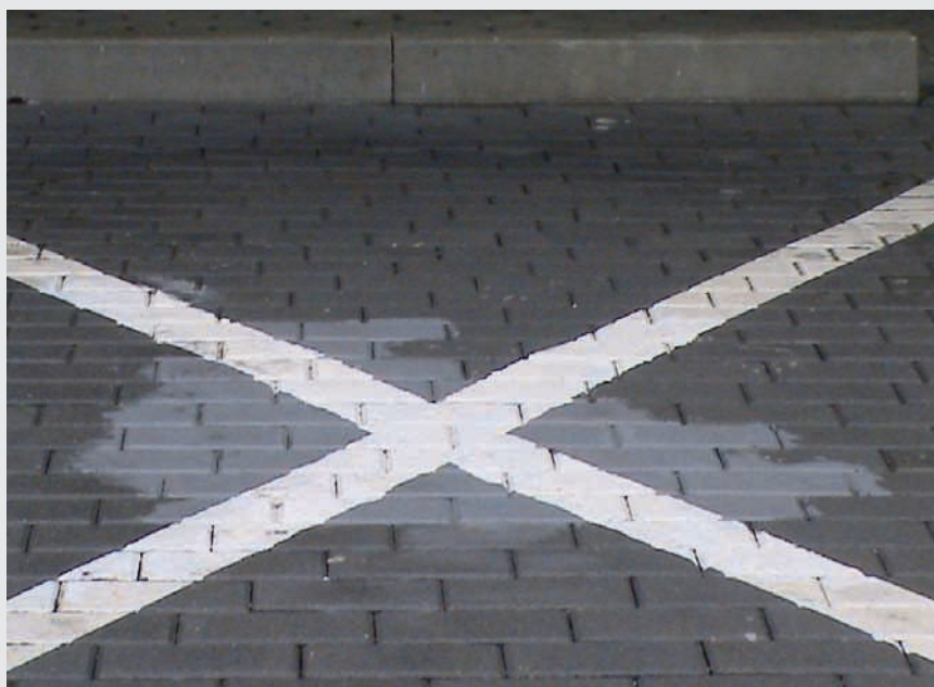
Obr. 2 Svojoľadne prefarbené miesto, pôvodne vyhradené pre hendikepovaných

Ak sa niekto chce na verejnosti čo najviditeľnejšie odprezentovať v tom, aký je ignorant voči ostatným ľuďom, azda sa to ani nedá lepšie, ako si neoprávnene zaparkovať auto na mieste vyhradenom pre imobilných. Je asi zbytočné vysvetľovať, prečo a na čo takéto miesta slúžia, a málokto si vie asi reálne predstaviť, akú dôležitosť v živote pre postihnutého majú. U nás na Slovensku je taký folklór, že určitá skupina ľudí sa priam predbieha v tom, ako sa takto zviditeľniť. Je, žiaľ, veľmi smutné, že sa tak deje na úkor najslabších jedincov