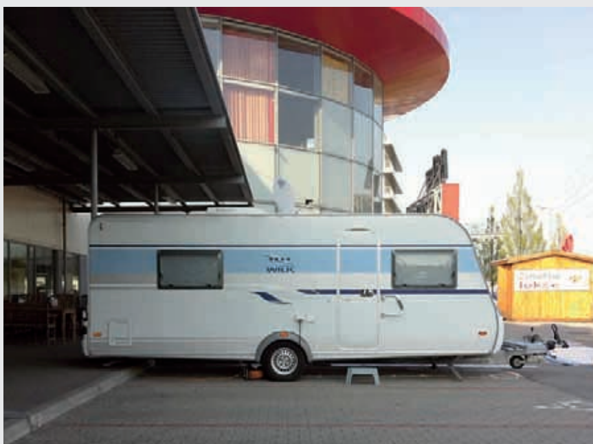
Obr. 6 Karavan dlhodobo odstavený na parkovacom mieste pre hendikepovaných

preto nie sú všetko. Raz mi jeden priateľ povedal: „Bol som v štáte, kde neoprávnené zaparkovať na vyhradenom mieste je azda väčšou neslušnosťou ako púšťať hlasné vetry pri slávnostnom obede.“ Nevieť si vôbec predstaviť, že dozrieme na takú úroveň, aby toto bola niekedy u nás pravda.