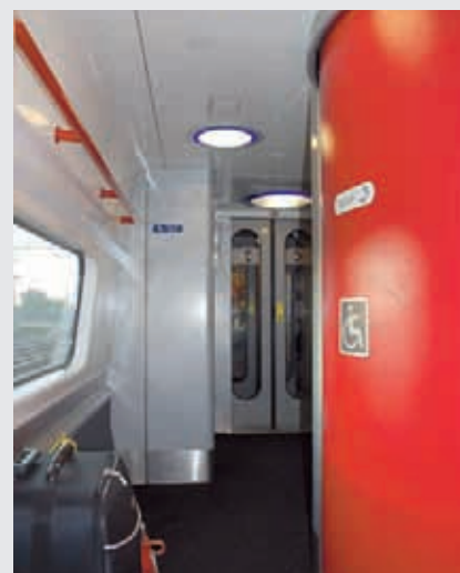
Obr. 4 Dizajn vlaku v Anglicku myslí na všetkých cestujúcich