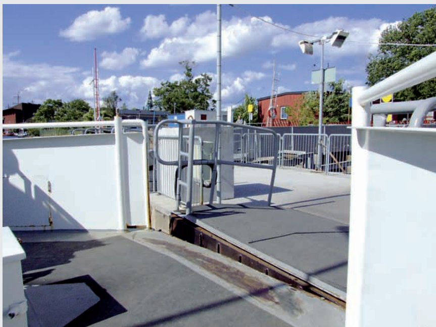
Obr. 5 Lodný taxík vo Švédsku umožňujúci bezbariérový nástup na loď a výstup z nej